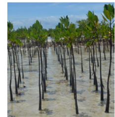
植林活動