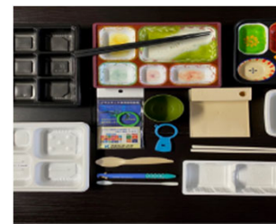
卵殻60%バイオマスプラスチック