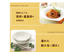
次世代バイオマス素材【Shellmine】