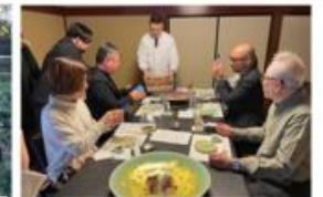
伝統工芸品での 高品質な食体験