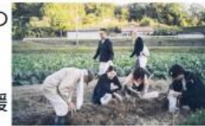
生産現場と食体験の連動