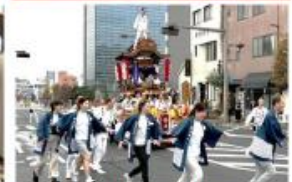
地域の伝統行事の活用