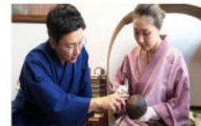
文化資源の活用 （伝統工芸）