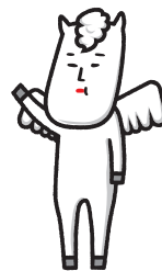
Hakuba village character VICTOIRE CHEVAL BLANC MURAO III

We will use the SWAT Mobility Japan system. SWAT Mobility Japan社の システムを使用しています。