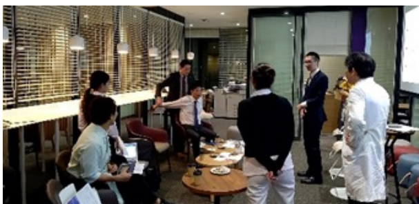
架け橋ピッチの様子