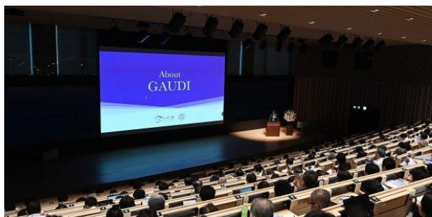
キックオフシンポジウムの様子

順天堂の誇る大規模臨床プラットフォーム（外来延患者数年間300万人以上、入院延患者数年間100万人以上）に迅速かつ容易にアクセスし、多様な研究開発を社会実装まで包括支援する体制を構築しています。