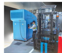
小規模 水素ステーション