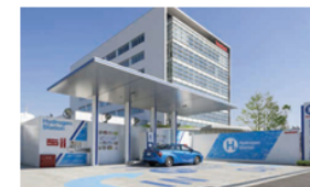
中規模 水素ステーション