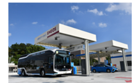
大規模 水素ステーション