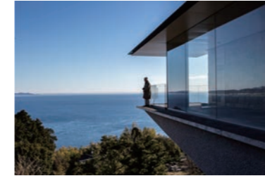
夏至光通拝 100m ギャラリー先端 © 小田原文化財団 The tip of the Summer Solstice Observation Gallery © Odawara Art Foundation

※見学は3時間の完全予約・入れ替え制。インターネットによる事前予約、または見学希望日当日の9:00より電話予約。