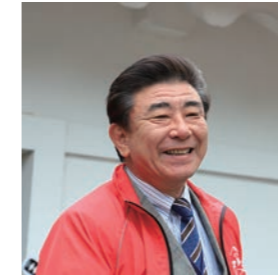
小田原城天守閣館長、諏訪 順氏 Dr. Jun Suwama, Ph.D. Senior Curator of Odawara Castle Museum

The main gates leading to the castles were also renewed. In Samuraikan (Samurai Gallery) on the second floor at Tokiwagi-mon (the gate Tokiwagi) you can see a collection of beautiful armor and swords. The projection mapping titled "Hana utsu yoroi" (The armor that beats flower) is also enjoyable. Through beautiful images and music, you will be able to be absorbed in the samurai spirit. On the first floor, there is a shop where you can rent samurai , ninja and princess costumes. Replica samurai armor is also available. You cannot enter the castle wearing samurai costumes, but taking a picture with the castle in the background is very enjoyable.