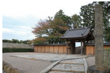
根津美術館から移築された明月門 Meigetsu Gate was relocated from Nezu Museum in Tokyo.

杉本博司氏が、人類の文明の始まりと滅びた後の美しさをも想定しながら、それを追体験する場所として作りあげた「江之浦測候所」。測候所という名前は、ここが宇宙と自分との距離を測るための場所であるからだとか。北条氏が鳴らした鈴の音の余韻が響き続ける小田原の地に、「江之浦測候所」ができたことにより、未来へと響き続ける鈴の音が新たに鳴らされたことを感じるができる。