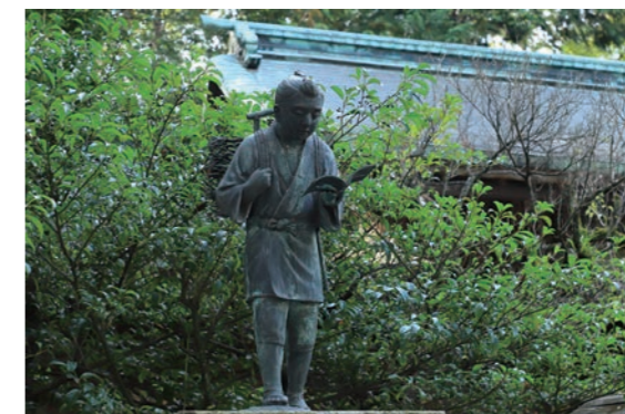
幼少の頃の二宮金次郎像

15 minutes on foot from the East Exit of Odawara Station