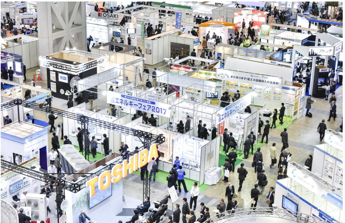
(参考) 前回開催時の様子

ビジネスマッチングの成果について、①出展直後、②出展後1ヶ月を目処に、③出展後半年を目処に、計3回程度アンケート調査を予定していますので予めご了承いただければと思います。