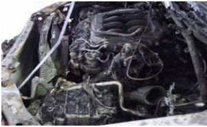
高濃度アルコール含有ガソリン （規格不適合品）による火災事故