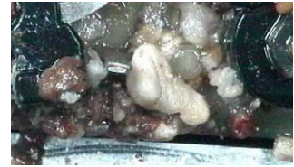
脂肪酸メチルエステル混合軽油 （規格不適合品）による固まり