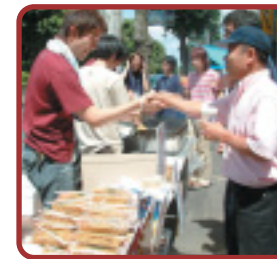
場所：千葉県千葉市 西千葉駅より徒歩3分 http://trywarp.com/

NPO法人TRYWARPでは、「こんにちは」の関係にひと工夫を加え商店街に新しい交流の場を生み出しました。 その工夫は、関係づくりの強化と来街への促進にも結びついています。 (詳細は裏面へ)