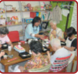
場所：東京都立川市 国立駅よりバス10分 http://members.jcom.home.ne.jp/npo-sarah/

NPO法人高齢社会の食と職を考えるチャンプルーの会では、地域の方々と昼食を取りながらの意見交換会を実施し、自分達の事業が常に要望に添ったものかを確認しています。今では地域になくはならない存在となり、レストランの宅配サービスを利用されるお客様からは「命綱」との声もある。 (詳細は裏面へ)