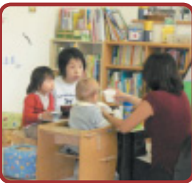
場所：神奈川県横浜市 菊名駅より徒歩2分 http://www.bi-no.org/

NPO法人びーのびーのでは、独自の収益事業や委託事業を組み合わせ地域課題解決に取り組んでいます。 事業は10年目を迎え、商店街にも子育て家庭にやさしいサービスの提供といったプラスの効果も表れてきています。 (詳細は裏面へ)