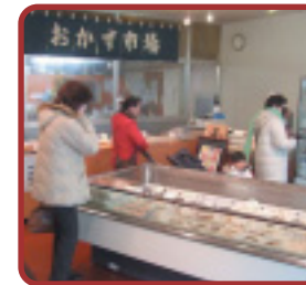
場所：長野県佐久市 佐久平駅より徒歩15分 http://www.iwamura.com/

岩村田本町商店街では、商店街振興組合の世代交代により、新たな事業に取り組みました。 今商店街には、一度離れたお客様がもう一度足を運び、買い物場所に困っていたお客様が新たに来ています。 (詳細は裏面へ)