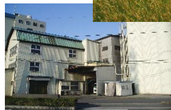
前田食品の製粉工場

原農場は温湯消毒による小麦の栽培に組み込み、その方法を確立するとともに、栽培面積を拡大し、遊休農地の解消を図る。前田食品(株)は、原農場で生産した小麦を使用し、全粒粉・石臼粉・ローストフラワー・ロースト小麦胚芽という新たな小麦粉製品の開発を行い、埼玉県産小麦の付加価値向上を図る。