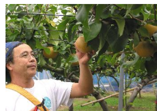
大塚果樹園の梨農園

地元春日部産の果物を使用した和菓子商品開発を模索していた(有)ちぐさでは、こだわりの梨栽培を実施している大塚果樹園に、梨の提供と安定的な供給方法の確立を依頼した。一方、大塚果樹園では味に問題はないが変形などの理由で規格外品となっていた梨の活用方法を模索していたため、今回の連携に至った。