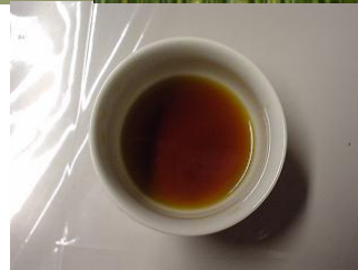
オリジナル 醤油 (試作品)