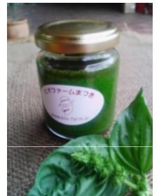
写真 バジルペースト (開発イメージ)

(株) Bioファームまつきは有機農業により生産した野菜を調理・提供しており、有機農業の推進が会社の理念の一つである。また百姓屋つくみは地元で有機農業を实践しており、収益拡大による安定した営農を志している。両者が有機的に連携することでお互いの課題を克服し、有機農業の推進に努めることが可能であることから今回の連携に至った。