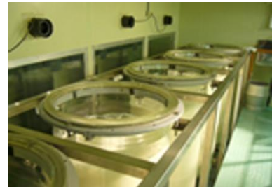
【5本のガラスタンク】

2年前から中小企業者である株式会社北雪酒造は、安心・安全・高品質な清酒への市場ニーズに対応して酒米生産を担える意欲のある前述の6戸の農家へ全面的な支援をするとともに、それらの酒米を全量購入して、大吟醸など高付加価値の清酒として製造・販売している。今般、新しい産地消費者交流型市場を開拓するため、「俺の酒」として内外の消費者からのオーダーメイドの酒づくりに挑戦するため、本事業を着手するに至った。