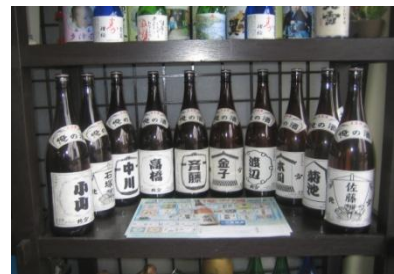
【オーダーメイドの酒の例】

本製品は、業界初となる「朱鷺と暮らす郷づくり認証米」づくりからこだわったフルオーダー清酒である。そのため、直接競合する商品は見当たらない。酒米から工場・生産農家までの酒米栽培履歴の証明を可能にし、健康志向の消費者をも満足させることが出来るという特徴がある。また、オーダーメイドの「俺の酒」(種別、アルコール分、ラベル、納期を選択できる)としての仕込みを可能にしている。さらに、顧客の個別嗜好に対応できる小ロットな受注生産が可能である。