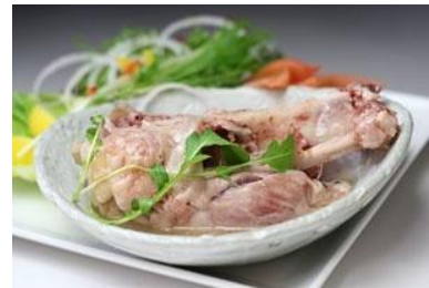
アイスバイン(骨付き豚すね肉の塩漬け)

「つくば豚」は、遺伝子測定技術を利用した、今までにない全く新たな豚である。消費者に好まれる、適性脂肪含有量を持つ豚のみを肥育・販売していくので、商品の当たり外れがなく、消費者の期待に背くようなことがない。また、つくば市とその周辺地域の畜産業者とともに本計画に取り組んでいくことによって、トレーサビリティを含めた安全性と地域性を両立した、積極的なブランド構築を実現し、全国的な需要開拓を図っていく。