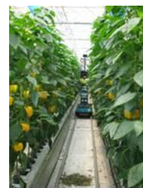
ペーストパプリカ