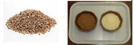
新規需要米からできる樹脂 バイオマスプラスチック コンパウンド

・事業開発の経緯 既存の農業用マルチシートは、産業廃棄物として処理する必要があり、高齢化が進む農家では撤去作業の労力が大きな負担となっている。そのため生分解性シートに対するニーズは高いが、現在流通している生分解性シートは高価であると同時に使用中に劣化が進むなど使い勝手が悪く、それらの課題を解決した生分解性シートが望まれている。 ・地域資源の強みと新たな活用視点の導入 米は、その順化作用により生分解性を高める優れた原料であり、籾殻は、低未利用な農産資源であり、安価で強度の発現に優れた原料である。新潟産米及び籾殻を用い、その提供者である農家のニーズにあった“環境負荷が少なく、農作業の省力化に貢献する”生分解性マルチシート等農業資材の開発販売を行う。