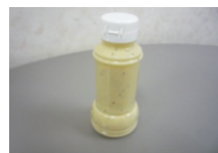
ドレッシング(試作品)