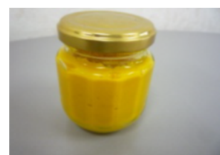
コンフィチュール(試作品)

既存の販売ルートに加え、地元での新たな販売ルートを確保する。また、商工会や観光協会等を通じた催事販売等により販路拡大を行い、地域産品とおいさにこだわりを持つ顧客へのPRを行う。更には、レストランチェーンや百貨店等首都圏の販売網への進出により、商品知名度アップを図る。