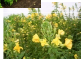
月見草の試験栽培 ↓