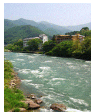
【美しい自然に囲まれた上牧温泉】