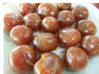
【遠州よこすか鉄砲玉(仮)】

新商品「遠州よこすか鉄砲玉(仮)」は江戸時代から伝わる製法及び地域の歴史背景を活かした「よこすかしろ」のあめ玉であり、江戸～昭和初期にかけての庶民の味の再現することで、他社にはないストーリー性のある「掛川市の新たな土産品」としてブランド化を図っていく。